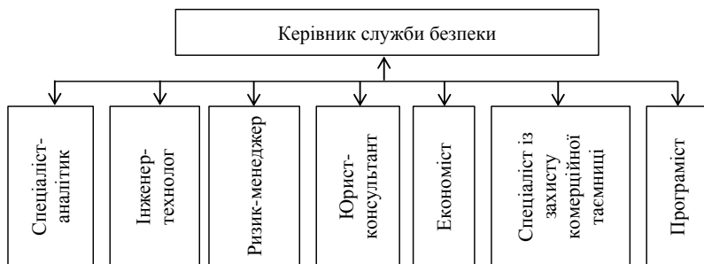
Рис. 1 – Базовий склад економічної безпеки підприємства (складено автором)

Типовий (базовий) склад служби економічної безпеки на підприємстві може включати керівника служби, економіста, юриста, ризик-менеджера, технолога, аналітика, програміста (Рис. 1).