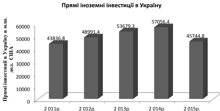
Рис. 1 – Динаміка прямих іноземних інвестицій в Україні за 2011–2015 рр. [1]

У зв'язку зі швидким ростом цін на сировину, енергоносії є основним фактором, що стримує темпи розвитку промислових підприємств. При оновленні технічної бази промислових підприємств зростає ефективність виробництва та продуктивність праці. При визначенні рівня технічної бази промислових підприємств потрібно враховувати державні програми. Для підвищення технічного рівня розробляються державні програми. Метою таких програм є підвищення технічного рівня виробництва. Для цього потрібно, щоб на підприємстві була організаційно-економічна основа (Рис. 2).