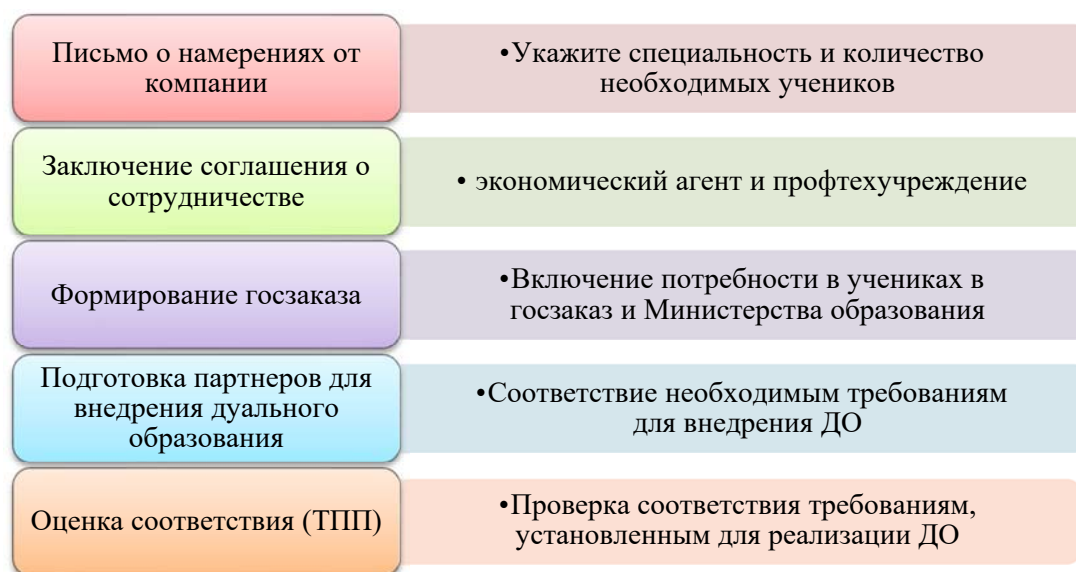
Рис. 2 – Процедура формирования дуального образования в Республике Молдова

3. В соответствии с постановлением правительства о дуальном образовании РМ процедура включает следующие действия (рис. 2):