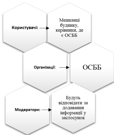
Рисунок 1 – Структура учасників у застосунку «Наше майбутнє»

Структура витрат: розробка застосунку, просування та реклама, обслуговування, кадрове забезпечення (рис. 2). Прибуток: від перегляду реклами, партнерство з клініговими компаніями та комунальними.